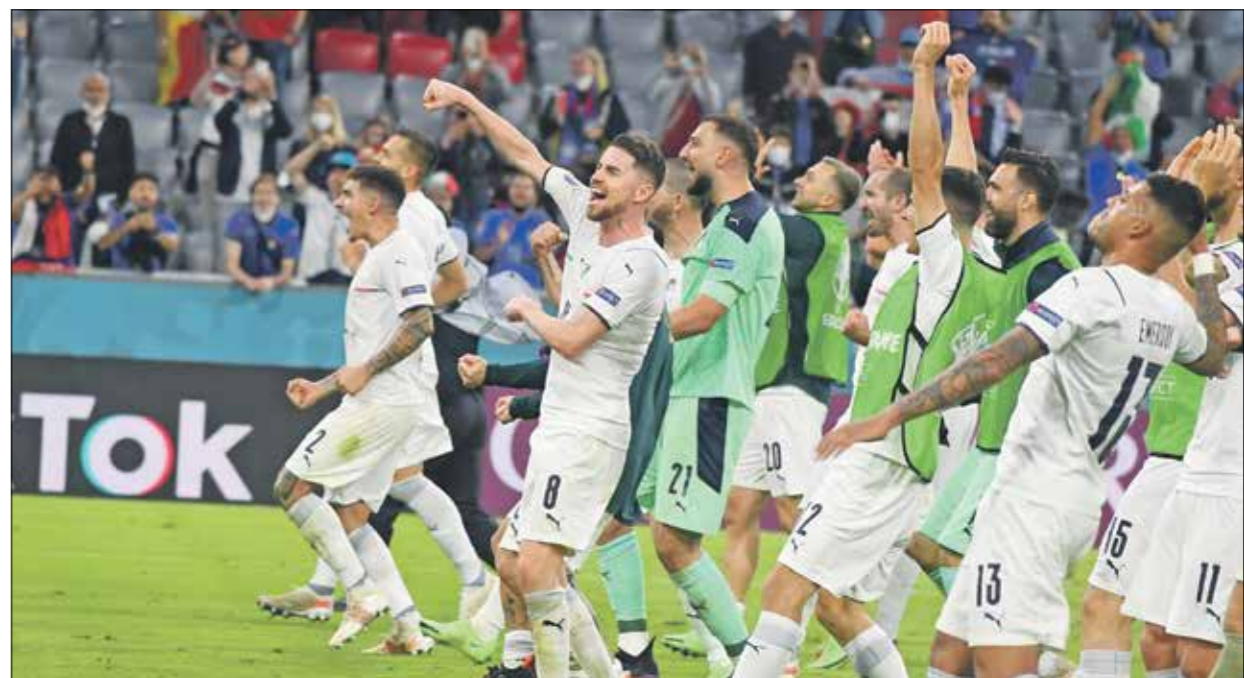
إيطاليا هزمت بلجيكا في ربع النهائي

تتجه انظار الجماهير الرياضية العالمية إلى ملعب «ويمبلي» الشهير في العاصمة لندن، اليوم الثلاثاء، من أجل متابعة المواجهة المرتقبة بين منتخب إيطاليا وخصمه العنيد منتخب إسبانيا، ضمن منافسات نصف نهائي بطولة أمم أوروبا لكرة القدم «يورو 2020». ويطلق على التنافس بين منتخب إيطاليا وخصمه منتخب إسبانيا، «دبري البحر الأبيض المتوسط» نظراً لأقدم المواجهات، التي بدأت بين البلدين المتوسطيين عام 1920 بدورة الألعاب الأولمبية في بلجيكا، بالإضافة إلى سلاقة بعضها 3 مرات في بطولة كأس