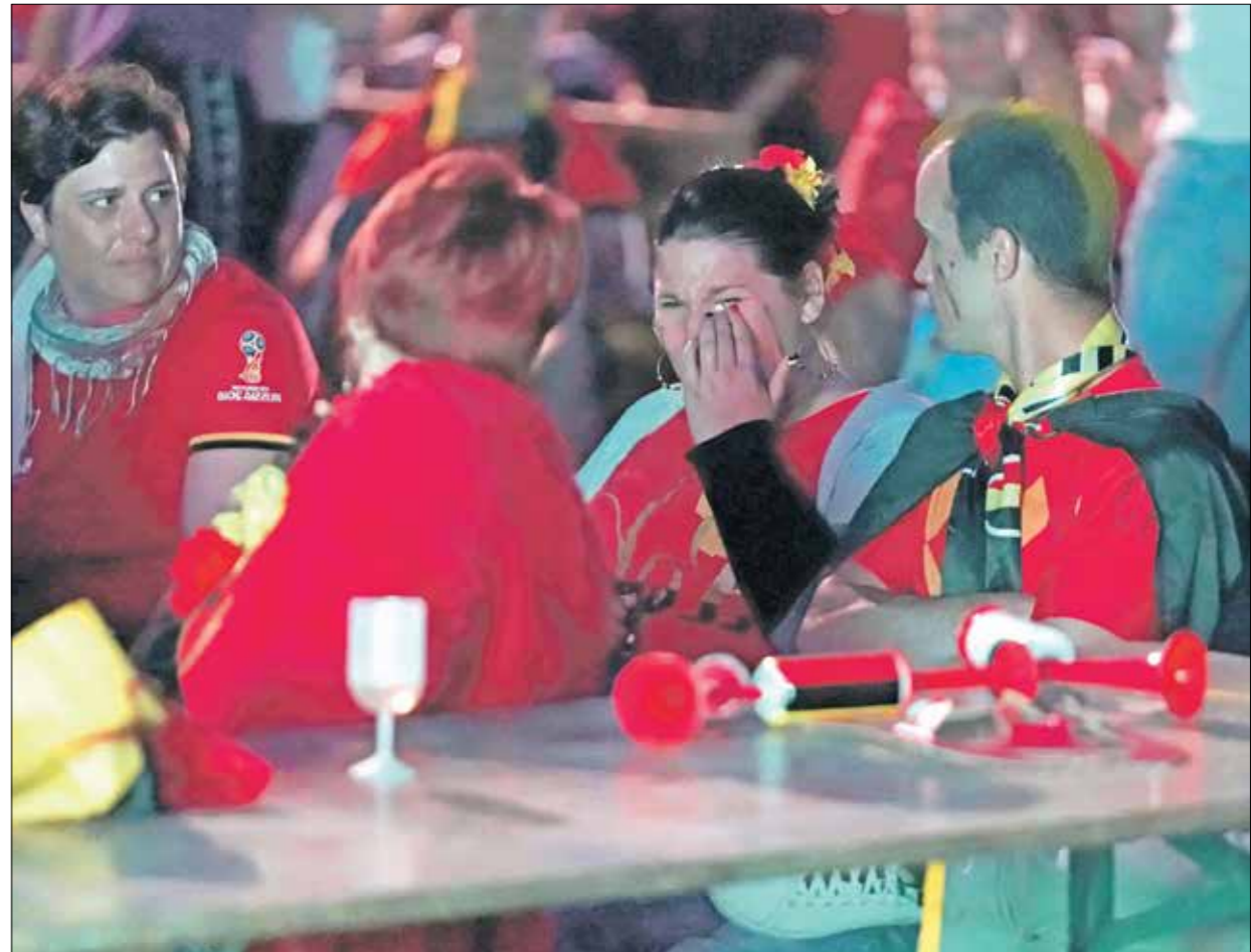
منتخب بلجيكا كان مرشحاً للقب لكنه فشل في لخطي ربع النهائي

العالم، وست مرات في بطولة أمم أوروبا، والتقى منتخب إيطاليا ومنافسه منتخب إسبانيا في نهائي بطولة أمم أوروبا 2012، وحقق فيها «الأرؤخا» انتصاراً عريضاً بارية أهداف مقابل لا شيء، وعادوا إلى مواجهة بعضهم في كأس القارات عام 2013 في البرازيل، فانتصر رفاق الحارس الكبير، إيكو كاسياس بركلات الجزاء (6-7)، وحقق منتخب إيطاليا وخصمه منتخب إسبانيا الفوز في 11 مباراة لكل منهما، من أصل 37 مواجهة، بما في ذلك 4 لقاءات في الألعاب الأولمبية في عشريينات القرن الماضي لينتقل بعدها الصراع إلى الأندية، التي سيطرت على منافسات «القارة العجوز».