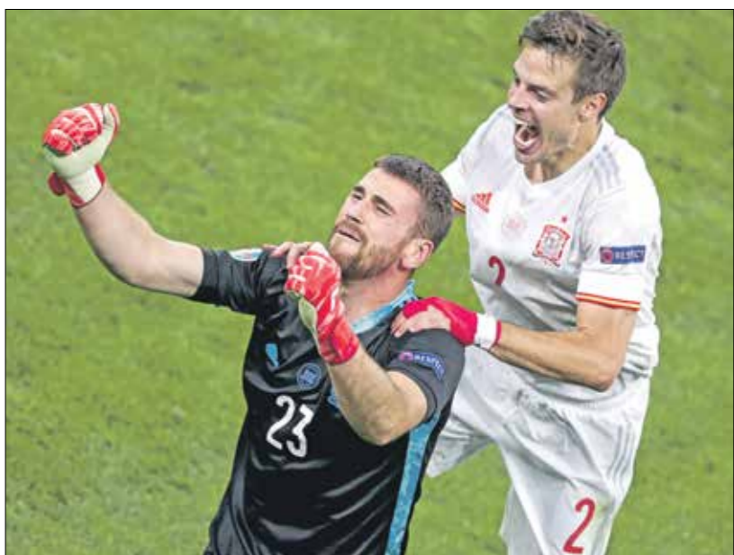
إسبانيا اصطحت بملعب سويسرا

تتجه الانظار إلى قمة اليوم الثلاثاء بين إيطاليا وإسبانيا، بعدما اصطاحت الولاة بلجيكا فيما هزمت الثانية منتخب سويسرا