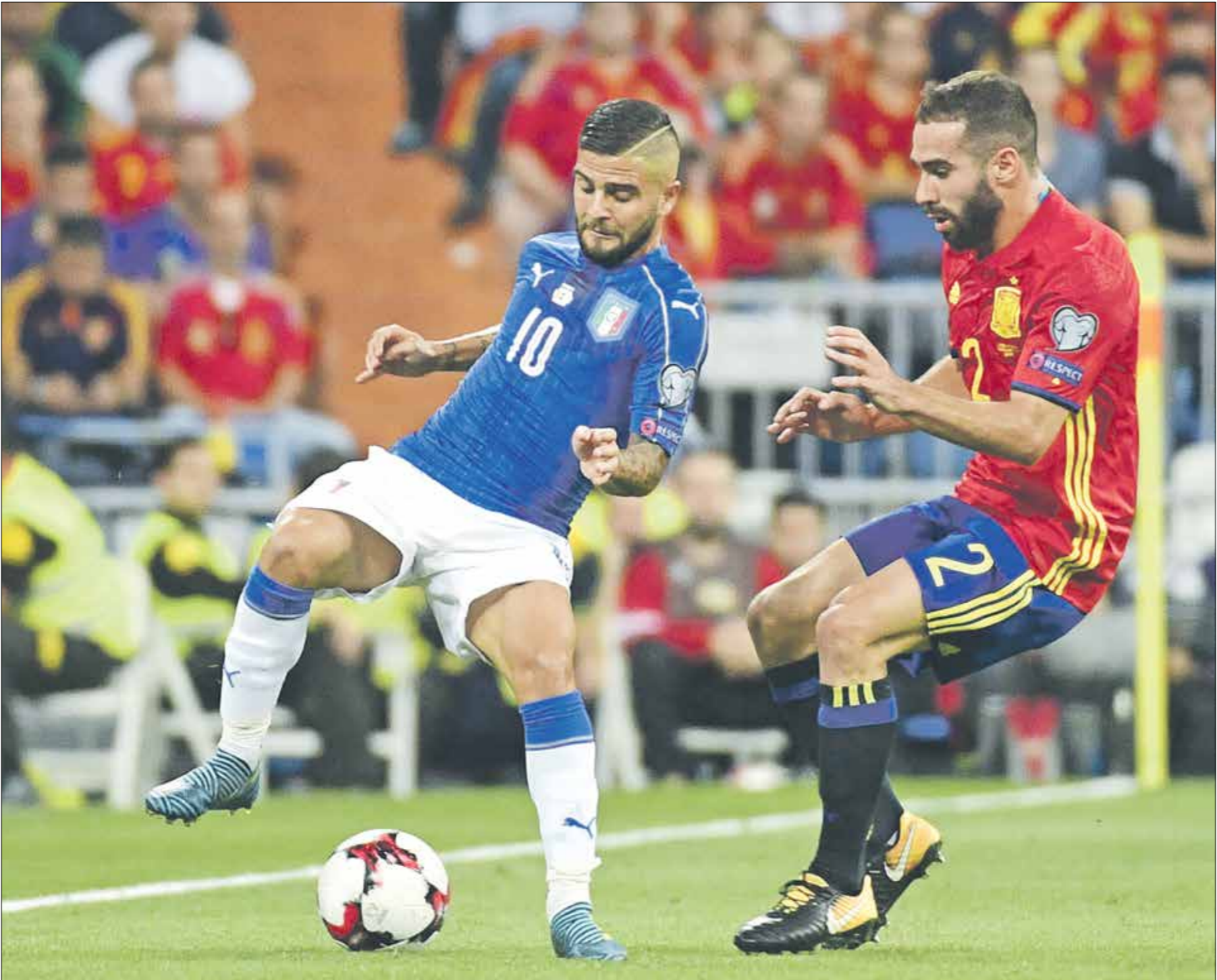
دريبي البحر الأبيض المتوسط بدأ عام 1920

وتلّام المدرب مارتينيز على الاعتماد على لاعبين يعانون من الإصابة ولم يكونوا في أفضل الجاهزية البدنية، وفي مقدمتهم