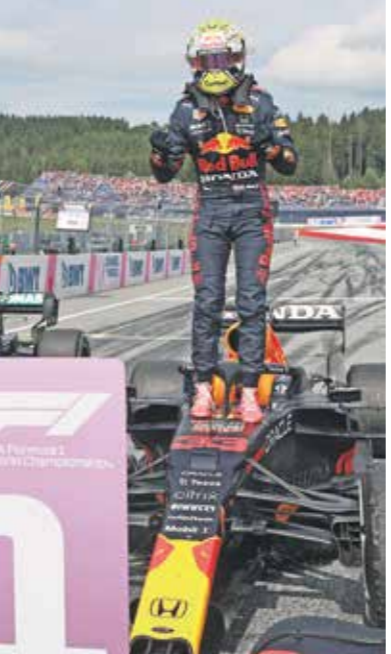
فيرستابن عزز صدارته في الترتيب العام

حقق سائق «ريد بول» الهولندي ماركس فيرستابن فوزه الثالث توالياً، عندما أحرز المركز الأول في سباق جائزة النمسا الكبرى، المرحلة التاسعة من بطولة العالم للفورمولا 1، على حلبة «ريد بول سيلبرغ» النمساوية، معرّزا صدارته في الترتيب العام إمام سائق مرسيدس البريطاني لويس هاميلتون، وعلى أرض الفريق النمساوي والحلبة التي تحمل اسم نفس الشركة المالكة له في سيلبرغ بالنمسا، حقق «إام ماركس» الفوز الخامس عشر في مسيرته، والخامس له خلال تسع مراحل حتى الآن هذا الموسم، متقدما على سائقي مرسيدس الثاني الفنلندي فالنيري بوتاس وماكلارين البريطاني لاندو نوريس، فيما حل هاميلتون، بطل العالم سبع مرات، رابعا، وقال فيرستابن الذي فاز بسهولة الأسبوع الماضي بجائزة ستيريا الكبرى على الحلبة ذاتها: «كانت السيارة خيالية، إنه عمل رائع للفريق بأكمله للوصول إلى هذا المستوى. لقد كان الأسبوعان رائعين»، وهي المرة الأولى التي ينجح فيها فيرستابن في الفوز بثلاثة سباقات متتالية بعدما حقق فوزين