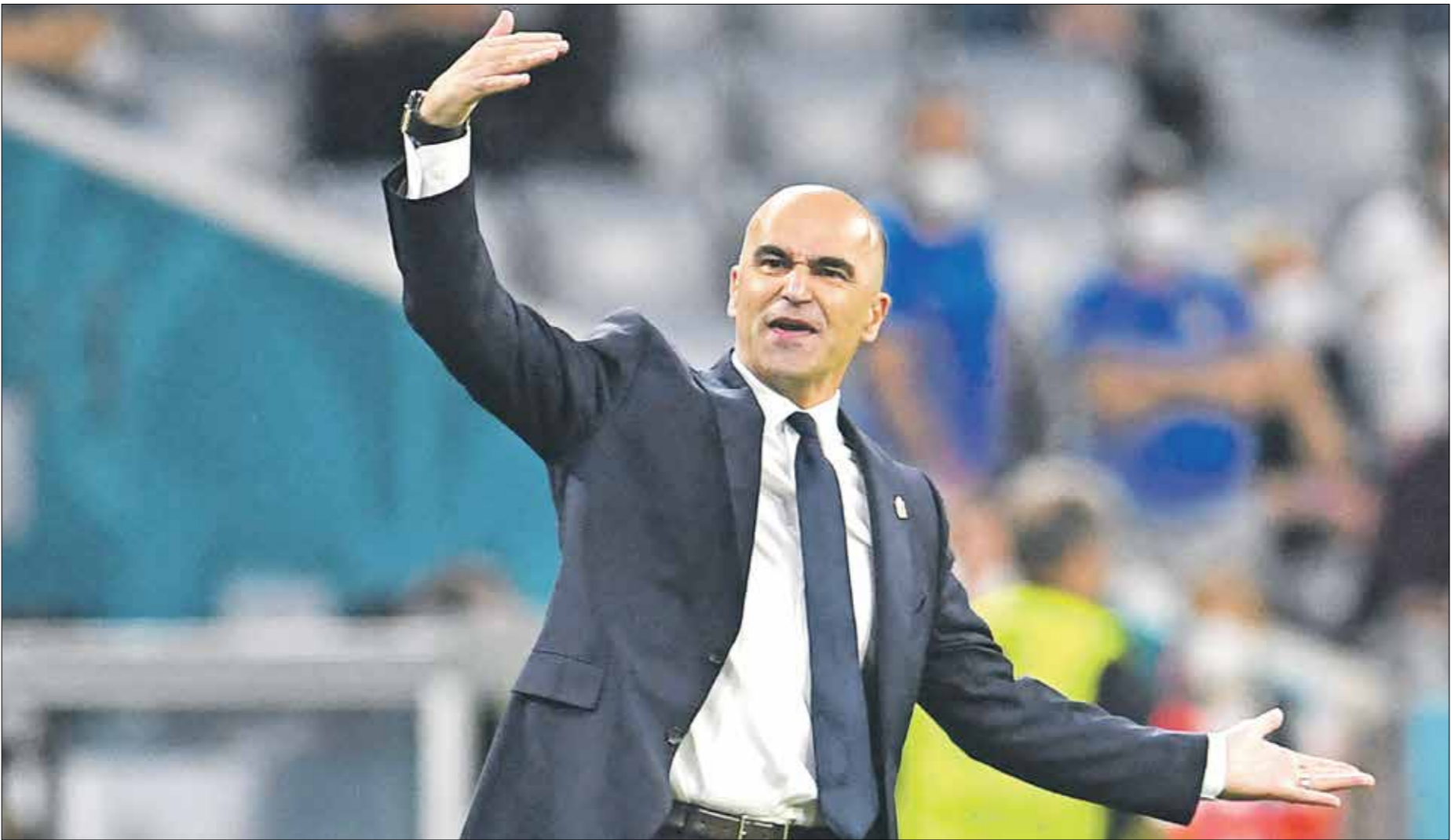
انفتحت بلجيكا خلال البطولة للقاء الجماهير مع مارتينيز

كان لورنزو إنسيني أحد أفضل اللاعبين في «يورو 2020» وأظهر هدفة ضد بلجيكا مرة أخرى مدى خطورته. عند الوصول إلى اليسار، ليس هناك الكثير الذي يمكن القيام به لإيقافه، ويسير على خطى النجم الهولندي، أرين روبين. وبالإضافة لإنسيني، يتواجد أيضاً في هجوم إيطاليا،