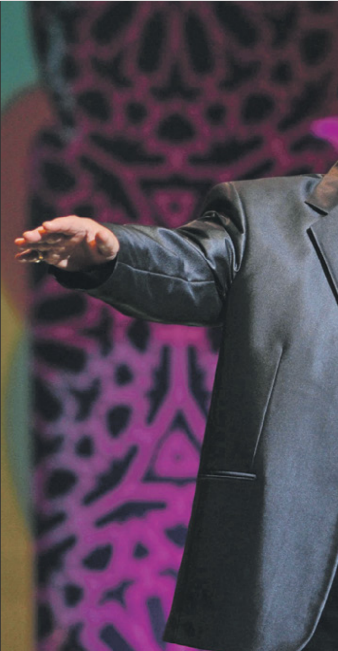
صباح فخري في حفل عام 2010