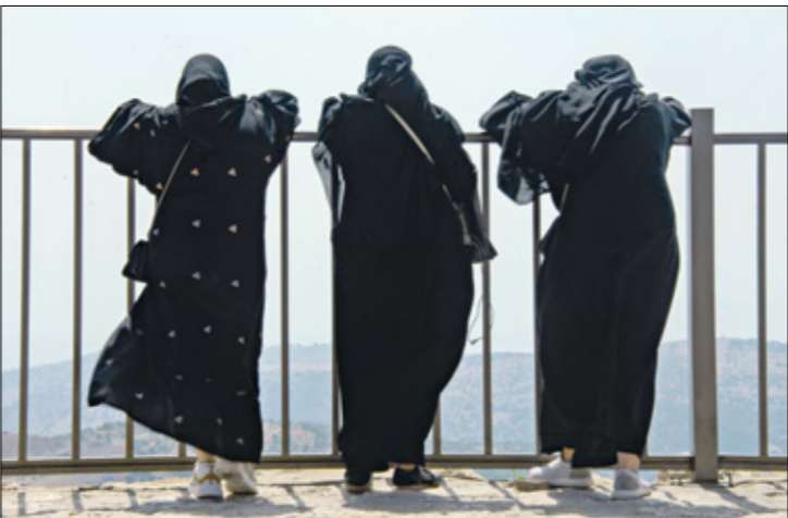
المرأة الأردنية تتأثر بانفراج كورونا

بررت جمعية «تضامن» ارتفاع حالات الانتحار بإجراءات مكافحة كورونا، وتحدثت مستوب الدخا أو فحذاته، وخسارة أفراد وظائفهم، وآر ارتفاع حالات العنف الأسري. واهلنرت أن محاولات الانتحار لدن النساء أصبحت قضية بالغة الخطورة بعدما بنّت بلائكّن نسبة 30 في المائة من عدد المتحررين، وينفذ 62 في المائة من أجمالي المحاولات.