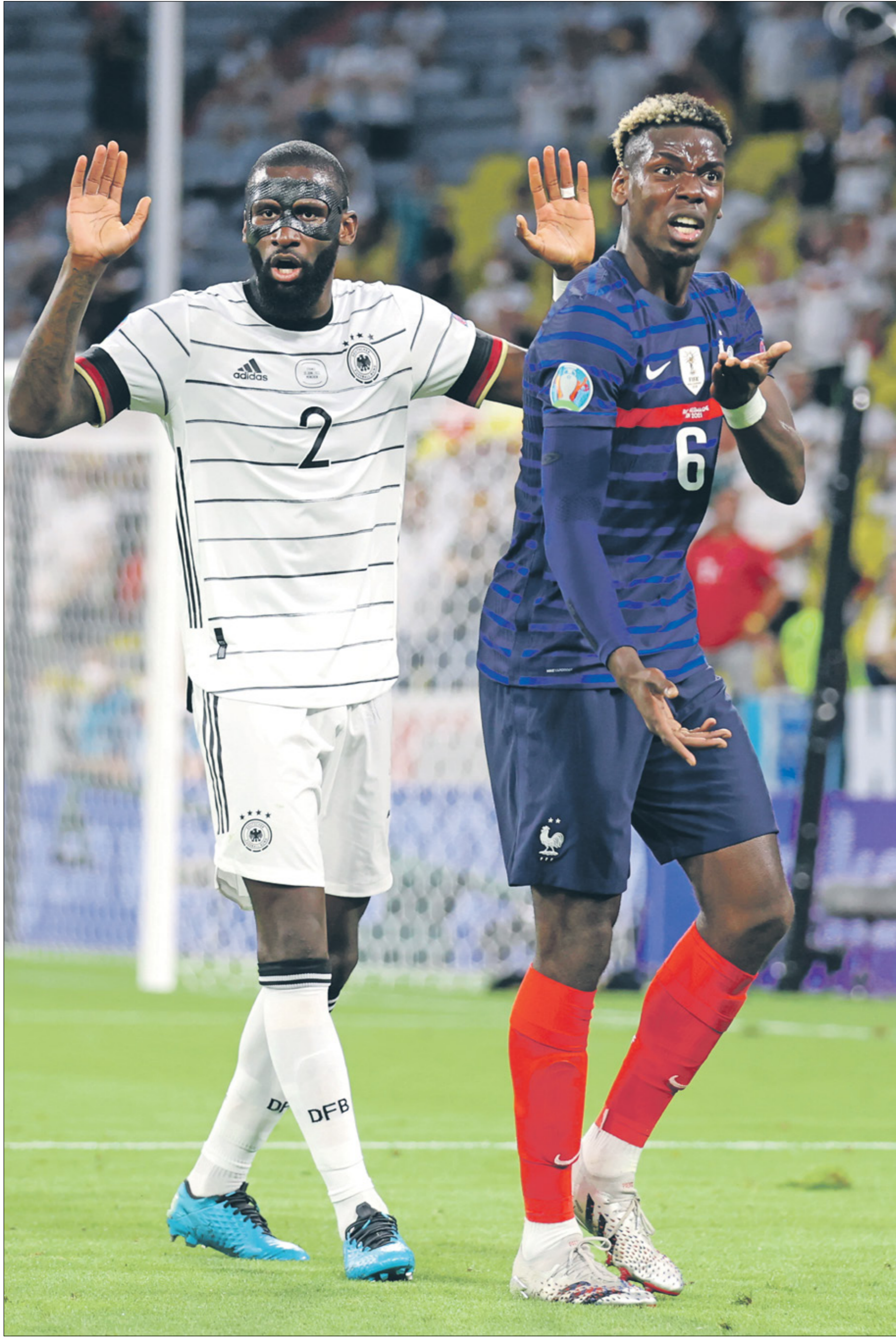
لديك رايك محدد سيشهد الثراب النقاء علفي بوغبا وروديجر فريرا (اليمين/ فريرم/ Getty)