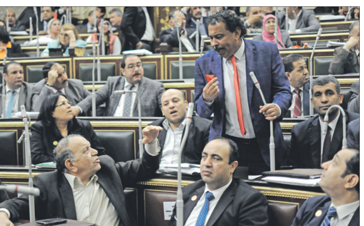
شكّن البرلمان مجلس حقوق الإنسان في أكتوبر

وبحسب القانون يتألف المجلس من 25 عضواً، أبقي مجلس النواب في التشكيل الجديد على ثلاثة منهم فقط، بينما تنص المادة 3 من القانون رقم 197 لسنة 2017 التي عدلت بعض أحكام القانون رقم 94 لسنة 2003 بإتشاء المجلس القومي لحقوق الإنسان الصادر في أول أغسطس/ آب 2017، على: «يبدأ مجلس النواب في إجراءات تشكيل مجلس جديد خلال 30 يوماً من تاريخ العمل بهذا القانون أو من