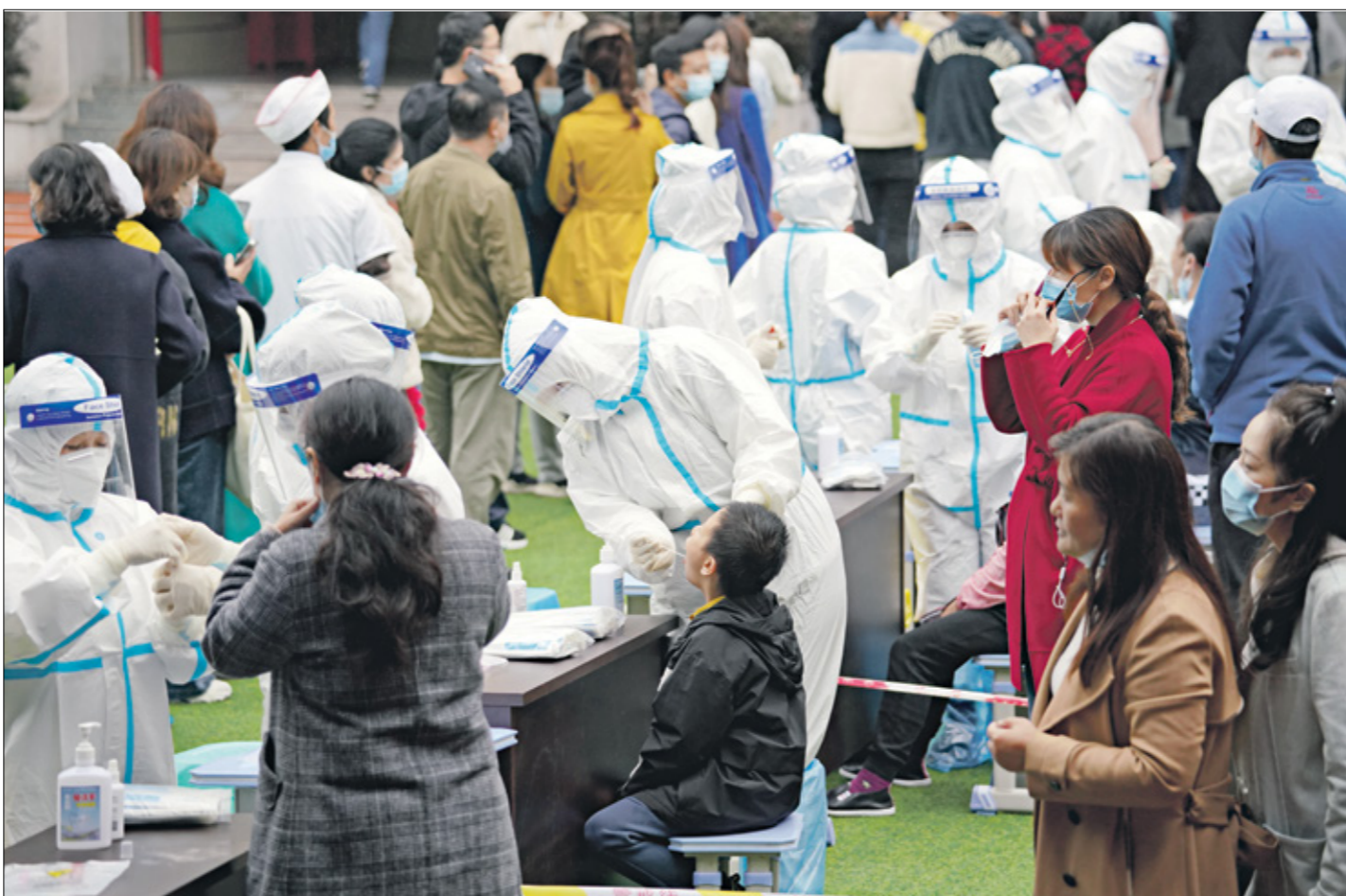
تجرّص محوصات كوفيد-19 بكلاهة في شيجياجوآن

وما سبّب في إرباك الصينيين أخيراً هو البيان الذي نشر على موقع وزارة التجارة الإلكترونية، والذي يدعو المواطنين إلى تخزين مواد غذائية استعداداً لحالات طوارئ في جديدها، الأمر الذي تعامل معه السكان بكين من الخلق والحذر، وقسر بعضهم الدعوة باحتفال لظهور طرفة جديدة من فيروس كورونا أكثر فتكاً، بينما ذهب