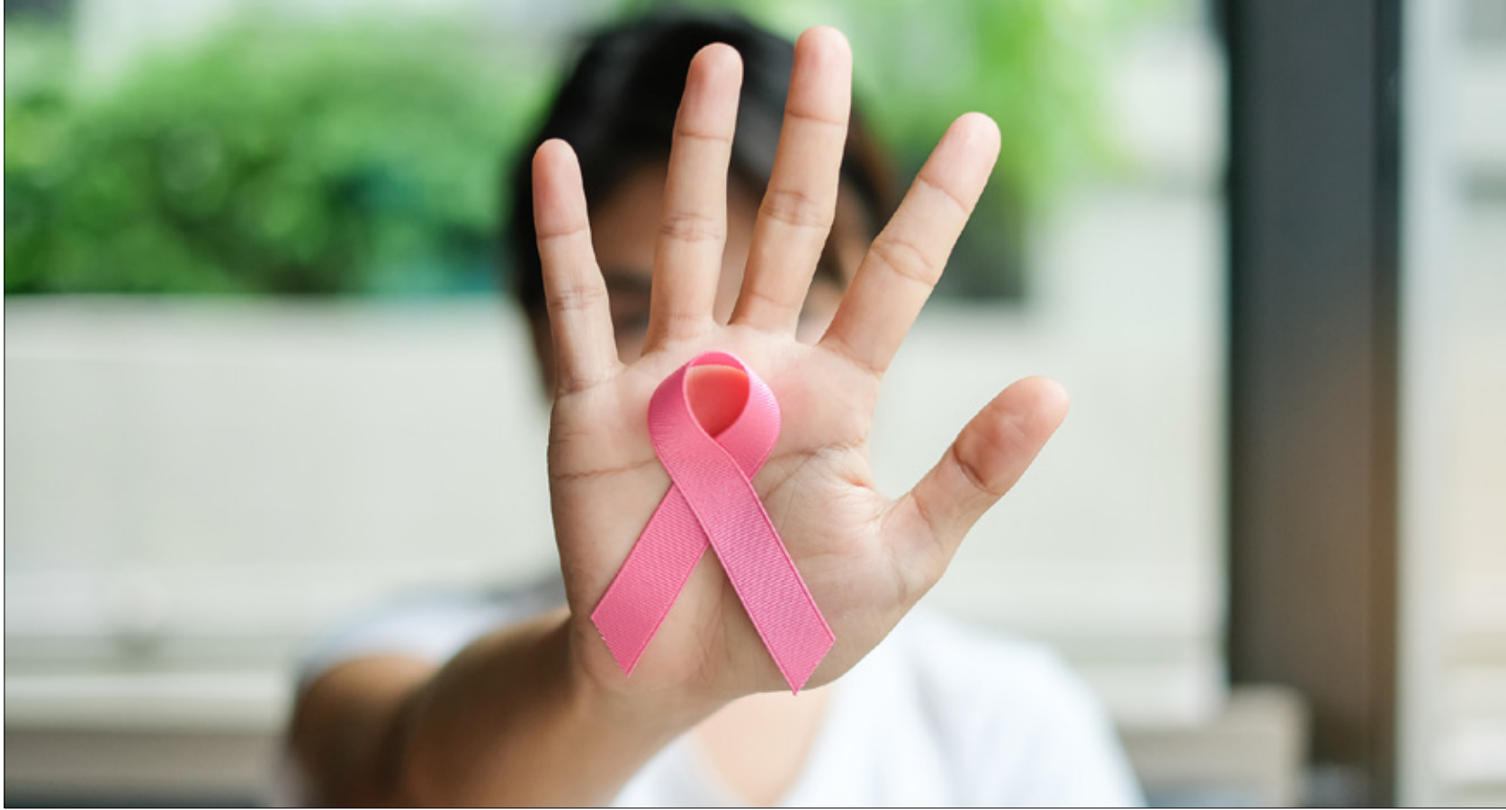
واحدة من كل ثماني نساء تُشخص بالإصابة بهذا المرض

بعيداً عن العوامل الوراثية، يمكن التقليل من إمكانية الإصابة بسرطان الثدي عبر اتباع نظم غذائية تحتوي على أطعمة من شأنها أن تحاربه، بسبب ما تحتويه من مواد مفيدة وصحية