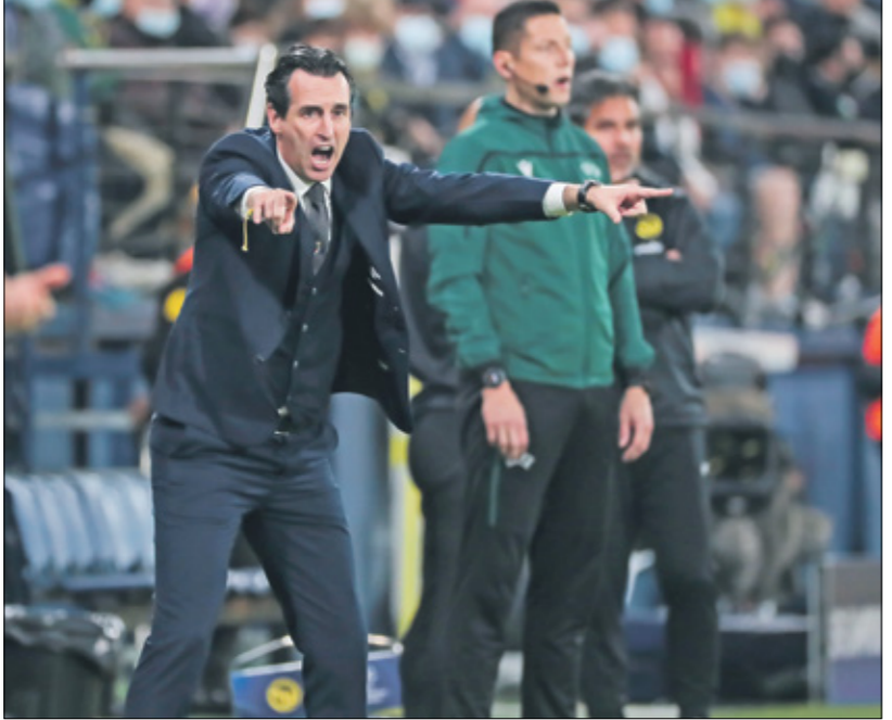
إيمري عاد فياريال إلى تلحح مصرلة (صيفيل بيراجازير)/Getty

ولا يزال زيدان، البالغ من العمر 49 عامًا، من دون أي شام، منذ مغادرته ريال مدريد في نهاية الموسم الماضي، بعد أن قاده إلى ثلاثة ألقاب متتالية في دوري أبطال أوروبا. ويحسب تقرير لصحيفة «ديلي ستار» الإنكليزية، فإن زين الدين زيدان رفض العرض، بسبب طموحه في أن يصبح مدربا لمنتخب فرنسا، خلفًا لديديه بلانشام، وبعد الخروج المفاجئ امام سويسرا في بطولة أوروبا 2020، كان هناك ضغط كبير على مدرب «الزرق» الحالي من أجل الاستقالة، لكن بعد حصد لقب دوري الامم قبل ايام، من المتوقع أن يستمر المدير الفني في منصبه حتى نهائيات كأس العالم 2022 في قطر. وأكد التقرير أيضاً، أن نجم الكرة الإنكليزية، فرانك لامبارد، هو المرشح الجديد لتدريب نيوكاسل، رفقة زميله السابق في منتخب إنكلترا، ستيفن جيرارد، وتشير شائعات أخرى إلى احتمال ارتباط نيوكاسل مع إريك تين هاج، مدرب أياكس الهولندي، أو باولو فوسكاتا مدرب روما السابق، أو الإسباني روبرتو مارتينيتز مدرب منتخب بلجيكا. (العربي الجديد، فرانس برس)