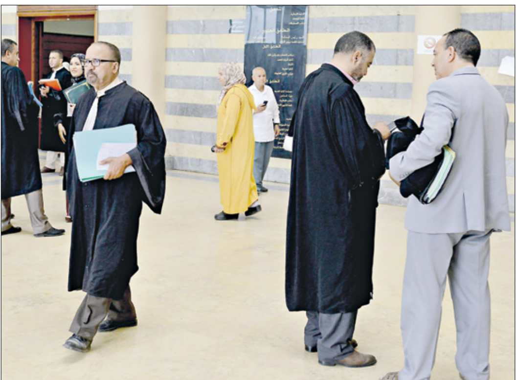
داخله،احمد المحاكم في المغرب

يخوض المحامون في المغرب معركة من أجل وقف التدهور الذي آلت إليه أوضاعهم المهنية، من خلال تنظيم احتجاجات ربّما تتحقّق مطالبهم