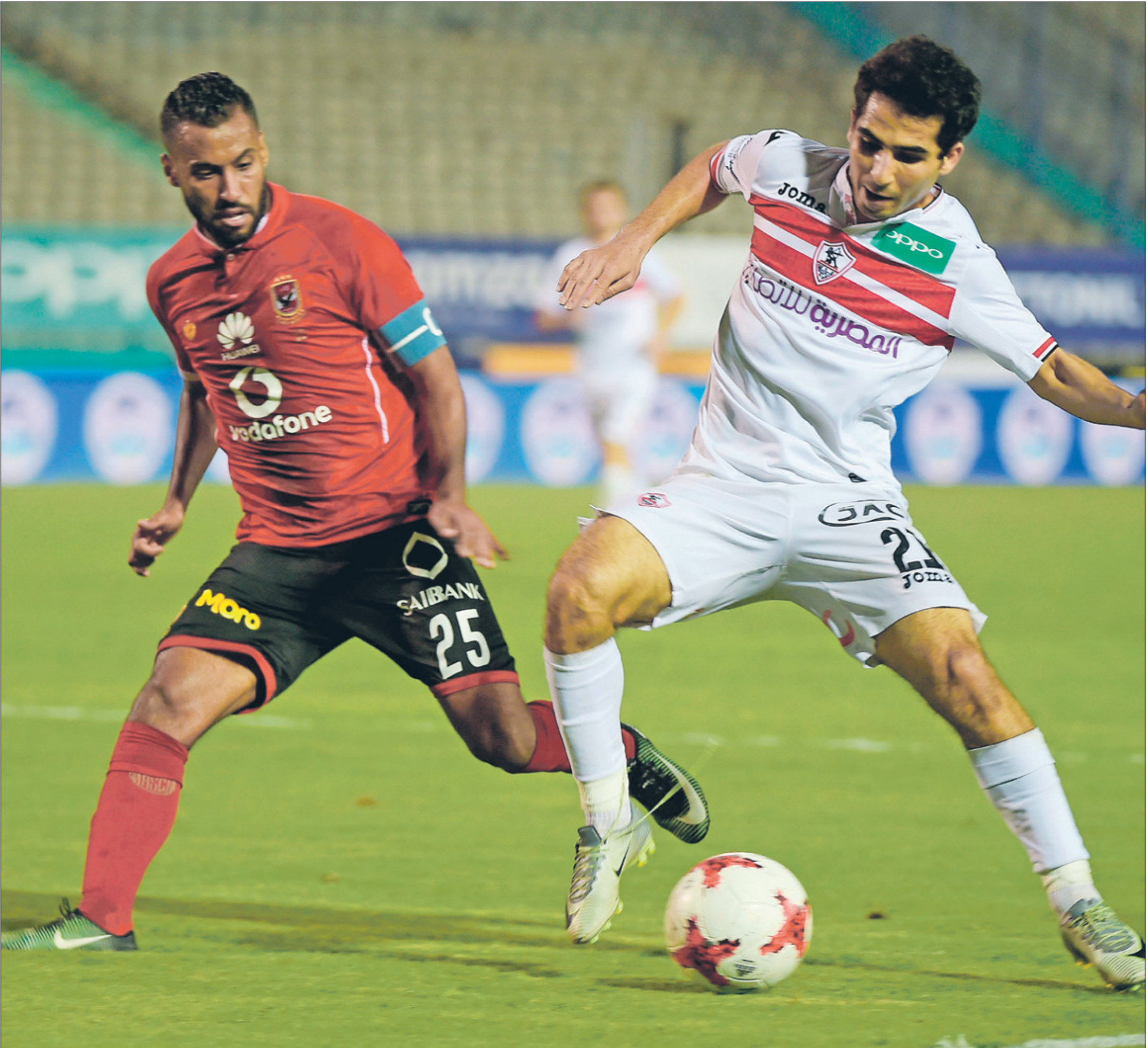
سيف بلتر عين الضريعت، فلمت سكوتون الضئبة (أخضر دوس)فرناس برس)

«المباراة صعبة، الأهلي يبدو جاهزا بشكل لافت وعم صفوفه بصفاقات قوية، هذا الأمر لا يعني أننا غير جاهزين، الزمالك يملك الأقل التعال في المباراة، وسنؤدي القمة الجديدة، ونحن نسعى للفوز، وحصد النقاط الثلاث، ومن جانبنا، أكد بيتسو موسيماني، المدير الفني للأهلي، في تصريحات إعلامية، بالنسبة لنا 3 نقاط، وأرفض الضغط على اللاعبين، وتحدث أكثر من مرة عن اللقاء، وقال موسييماني «المباراة لن تكون سهلة، والتركيز في إنهاء الهجمات، ولدينا فرصة كبيرة في الحصول على 3 نقاط إذا ما كان التوفيق حليفنا، الأتلت اتذكر لقاء الدور