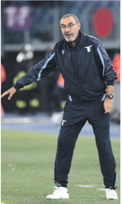
لانسو عاين مع تراجع فريق اللاناج مع ساري التاليجون بالتحاليز

شهدت نتائج بعض الأندية في الدوري الإيطالي هذا الموسم، تراجعاً كبيراً، خاصةً نادي يوفنتوس الذي مز بفكرة صعبة خلال الأسابيع الأخيرة، ولم يقدر الفريق على تحسين ترتيبه، رغم أنه يملك رصيداً شريفاً مهماً، وسعى المدربون إلى البحث عن الحلول التي تساعدهم على تحسين النتائج بشكل يسمح للأندية بعدم الإبعاد عن فرق الصدارة، ذلك أن إشكال تواضع النتائج لاحق ذلك فريقَي لانسو وكالياري وغيرهما من الفرق التي خيّبت آمال الجماهير في بداية منافسات الكالتشيو الذي يبدو هذا الموسم مشتتاً. وبحثاً عن تحسين النتائج، ونظراً لعدم قدرة الأندية على القيام بصفقات بعد غلق سوق الانتقالات، فإن المدربين بحثوا عن الحلول الجديدة، بهدف تشجيع اللاعبين على رفع مستوياتهم، ودفعهم إلى مراجعة طريقة لعبهم لتفادي ضغط الجماهير التي لم تعد مستعدة لمشاهدة فريقها في أسفل الترتيب، ولحا مدربيون إلى فرض معسكرات طويلة، لا يسمح خلالها للاعبين بمغادرة المنزل إلا بعد أكثر من عشرة أيام، مع قرب