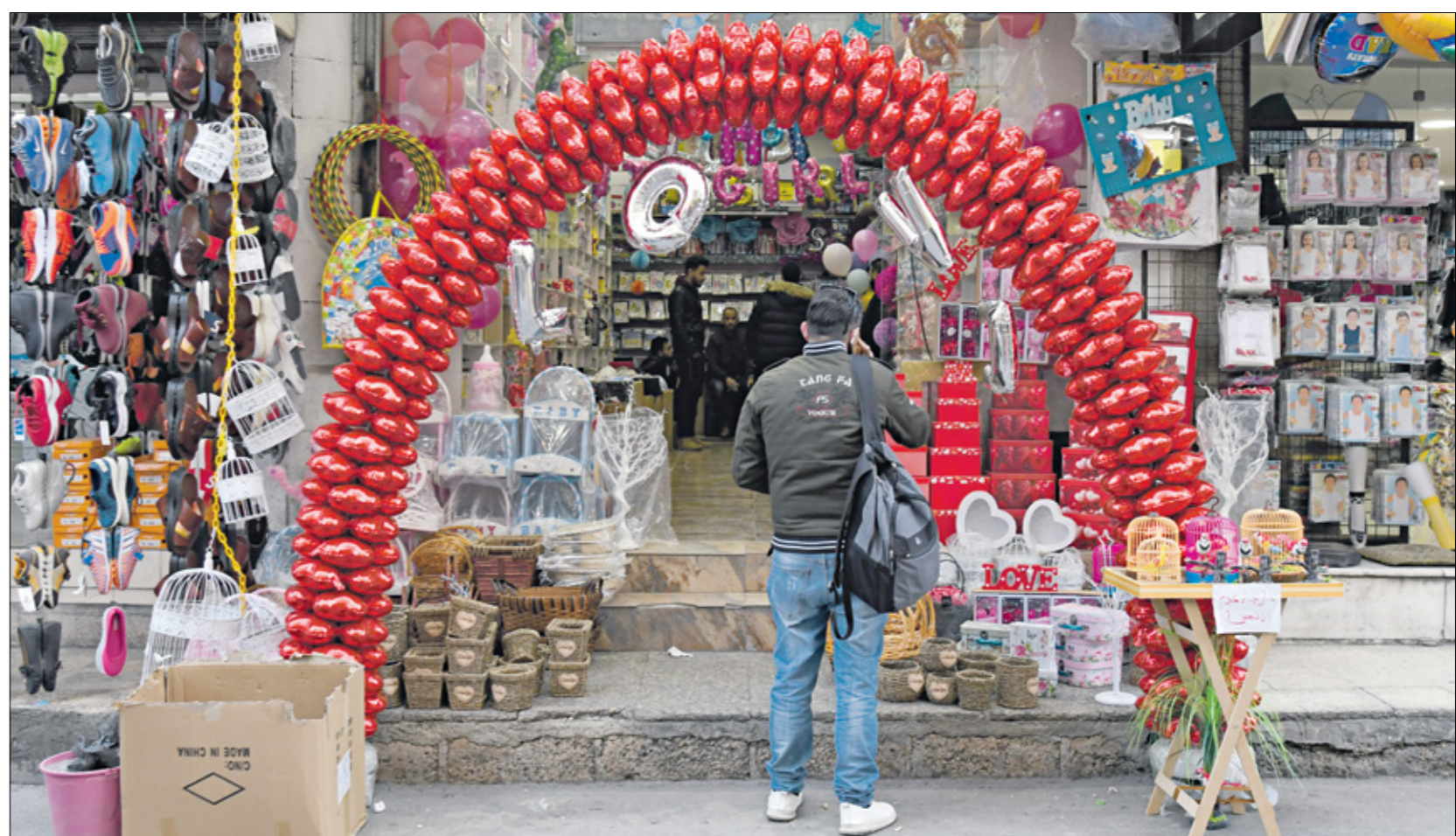
كورونا عطفك ضغوطات وأحلامها

تؤكد الأرقام أن حالات الانتحار في الأردن العام الماضي قد تكون الأكبر على الإطلاق. ويعزو خبراء السبب الرئيسي إلى تأثيرات كورونا