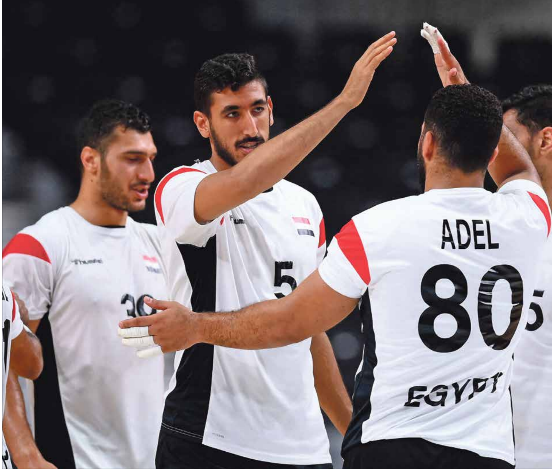
المنتخب المصري مرشح بقوة لبيلوغ نصف النهائي

وستكون مواجهة المنتخب البحريني ضد المنتخب الفرنسي صعبة جداً، نظراً لقوة «الديوك» والسئوسى القوي الذي ظهر بشكل واضح في دور المجموعات، حتى أن بعض الصحف والمواقع الرياضية رشحت المنتخب الفرنسي لكي يتوج بالميدالية الذهبية في أولمبياد طوكيو. وقيل لمواجهة الفريقين أعرب مدرب البحرين الإسليندي، أرون كريست بانسون، عن