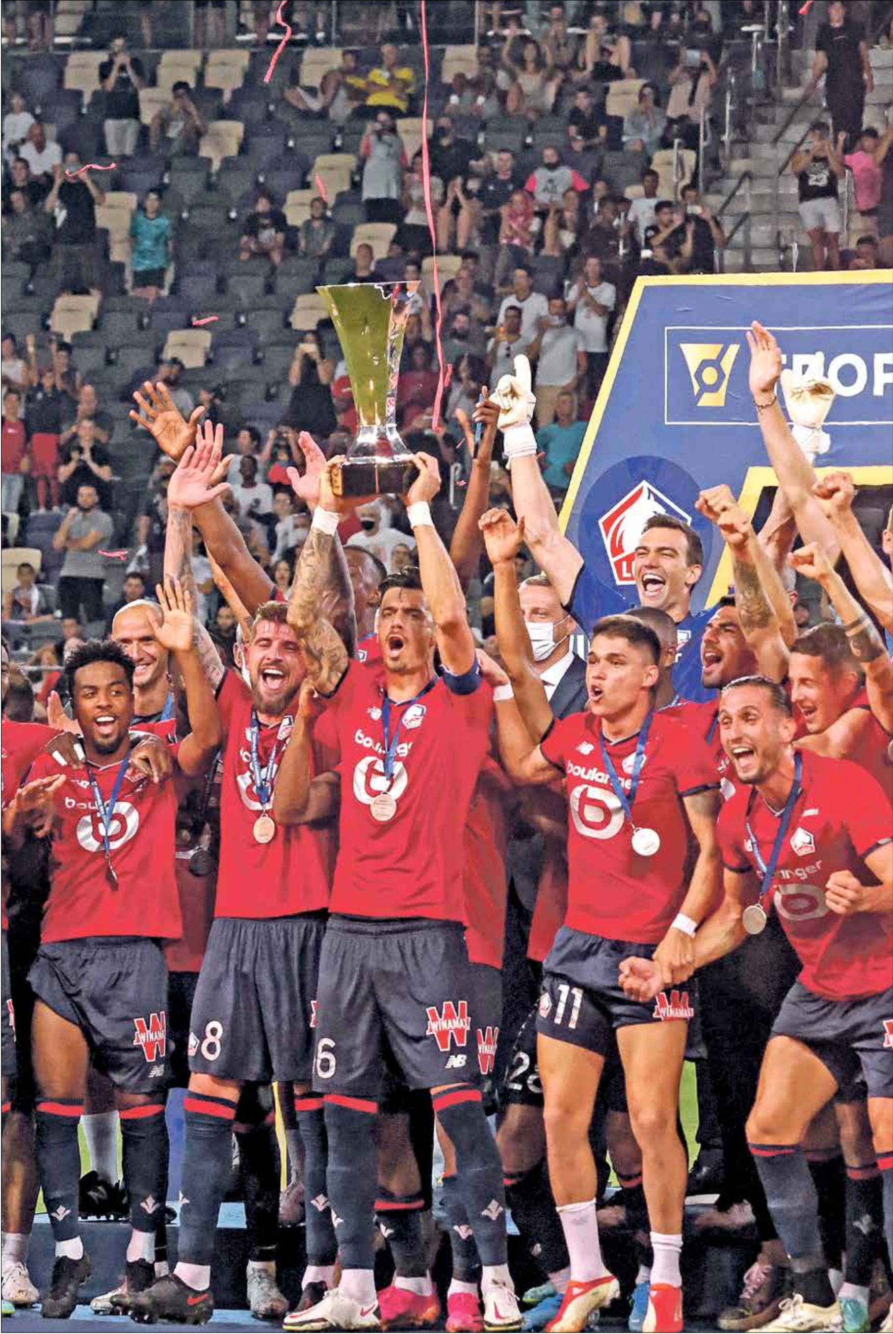
ليك يُحقق لقباً جديداً في فرنسا

ازاح ليك منافسه باريس سان جيرمان من التربع على لقب بطولة كأس السوبر الفرنسي خلال السنوات الثماني الاخيرة بعد أن تغلب عليه بهدف نظيف. وبهذه النتيجة واصل ليك مسلسل حصد الألقاب بعد أن توج بلقب الدوري الفرنسي في الموسم الماضي بعد هيمنة كبيرة من «الباريسي» على البطولة في السنوات الاخيرة. هذا وتعد هذه هي البطولة الأولى التي يخسرها سان جيرمان في الموسم الجديد.