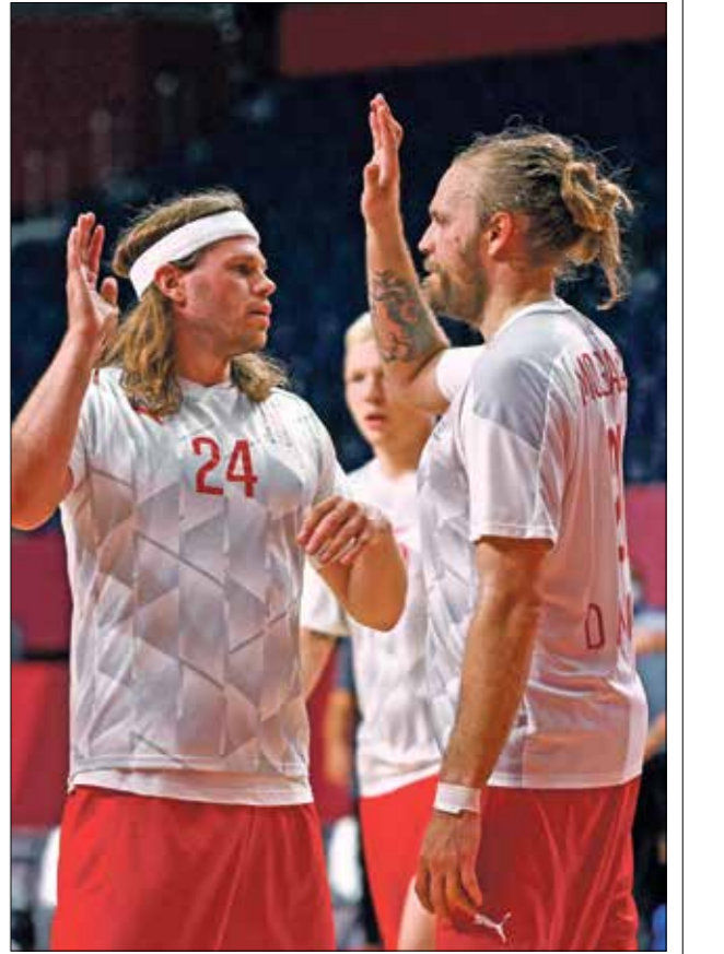
المنتخب الدنماركي مرشح للمنافسة بقوة

مجموعته بتحقيقه أربعة انتصارات من أصل خمس مباريات، في وقت حلت ألمانيا منافسة «الراغنة» في هذا الدور ثالثة في مجموعتها بثلاثة انتصارات وخسارتين. وتملك ألمانيا أفضلية واضحة في تاريخ مواجهاتها مع مصر، في وقت خرج المنتخب العربي فائزاً في دور المجموعات في أتلانتا 1996 وسيدني 2000. عندما حقق أفضل نتائجه محتلاً المركزين السادس والسابع خوالياً، وبدا