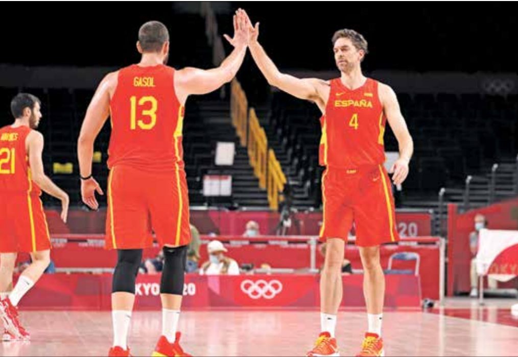
المنتخب الإسباني يريد الوصول إلى النهائي

تفوّقت الولايات المتحدة على إسبانيا في النسج الثلاث الأخيرة، إلا أن المنتخب الأوروبي بطل العالم يأمل هذه المرة في فك عقده، عندما يتواجهان اليوم في الدور ربع النهائي لمنافسات كرة السلة في أولمبياد طوكيو، في وقت يتوقع عبور فرنسا وسلوفينيا. وتوّجت الولايات المتحدة بذهبية بكين 2008 ولندن 2012 على حساب إسبانيا في النهائي. قبل أن تقصّبها من دور الأربعة في أولمبياد ريو قبل خمسة أعوام، لتكتفي الأخيرة بالبرونزية، ويحرز الأميركيون ذهبية ثالثة توالياً وسادسة في آخر سبع نسخ، إلا أن إسبانيا قد ترى الفرصة مواتية هذه المرة، نظراً لأن الفريق الأميركي لم يعد يشكل تلك القوة الضاربة على غرار الدورات الثلاث الأخيرة، رغم أنه لا يزال يضم أسماء كبيرة أمثال كيفن دورانت، وكانت إسبانيا قادرة على تفادي مواجهة الولايات المتحدة لو نجحت في الفوز على سلوفينيا في المباراة الأخيرة من دور المجموعات، وتغادرت احتمال أن توفّعها القرعة مع المنتخب الأميركي، إلا أن لوكا دونتشيتش وزملاءه كان لهم رأي آخر ليتمسروا المجموعة المنافسة، قبل أن تسفر القرعة عن مواجهتهم لألمانيا، في وقت شاء القدر لإسبانيا أن تلاقي المنتخب الأميركي القوي.