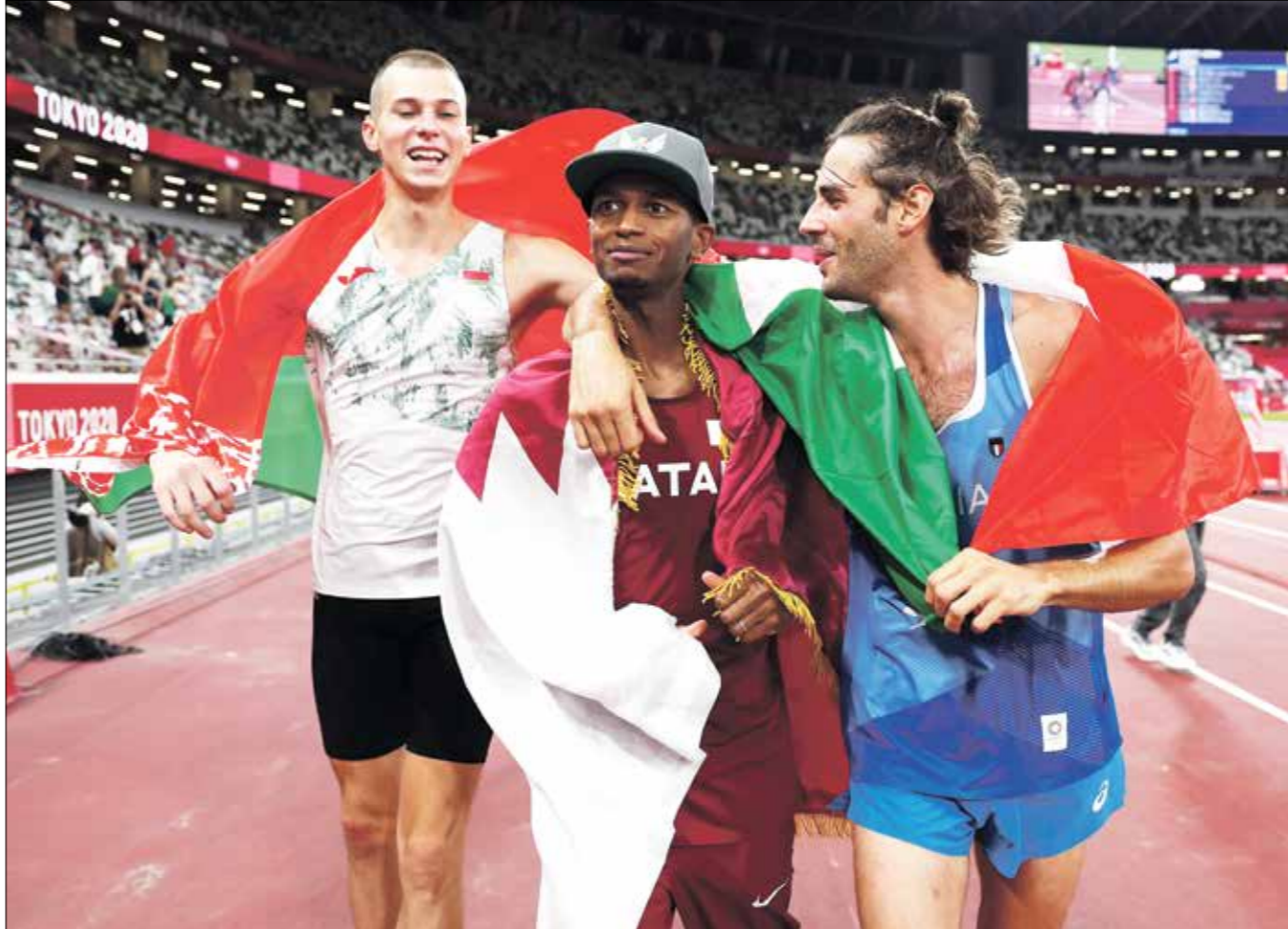
برشم وتامبيري يطلا الميدالية الذهبية في الوثب العالي

بعد هذه القصة التي قاسمها جمانماركو تامبيري مع متابعيه قبل ثلاث سنوات، عادت للواجهة بعد التتويج الثنائي بذهبية طوكيو، إذ فضل برشم وفي تصرف إنساني رفض خوض جولة فاصلة بينه وبين صديقه، لتحديد هوية الأفضل منهما. وانتظر تامبيري رد برشم للحكم الذي حاول التعرف على رغبته في مواصلة المنافسة، غير أن برشم وفي لوان معدودات، تذكر سنوات الصداقة التي جمعتها الإيطالي، واستعاد الكلمات التي تقاسم عبرها الأوقات الصعبة التي عاشها منافسه، ليجعل الذهب نصيبه وتصيب صديقه، ويلتذ بها معاً.