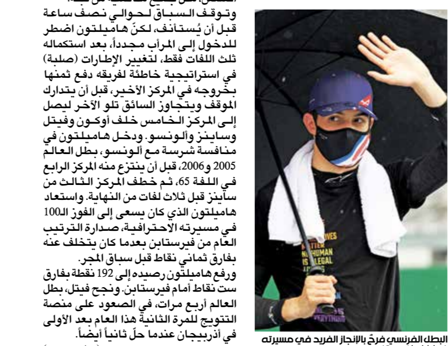
البطل الفرنسي فرغ بالبحار المرقد في مسيرته

ومنح الين، الاسم الجديد لـ«رينو» في الفورمولا 1، الفوز الأول لفرقة منذ 2008 عندما توج الونسو بجائزة اليابان الكبرى، واستفاد أوكون (24 عاماً) من الانطلاقة الكارثية للسباق الأخير قبل فترة التوقف الصيفية، والحظ العاثر لفيرستابن والاستراتيجية الخاطئة لهاملينتون وفرقة «مرسيدس» بخصوص الإطارات، ليصبح السائق الفرنسي الرابع عشر الذي يصعد على أعلى منصات التتويج في الفورمولا 1 أبرزهم بطل العالم أربع مرات الآن بروس (1٥ فوزاً) وروبنه أرنو (7)، وحذا أوكون حذو