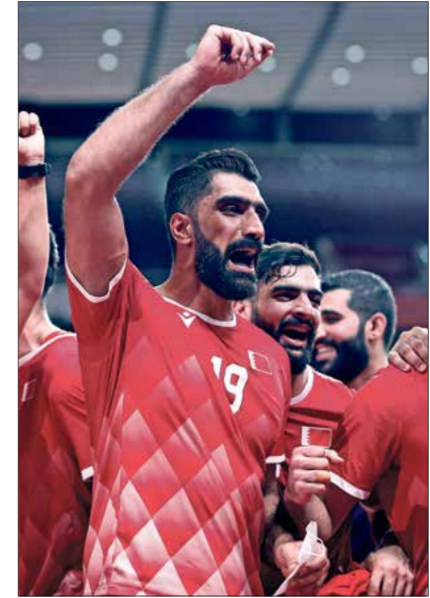
المنتخب البحري تأهل من المركز الرابع

سيخوض المنتخب المصري مباراة في غاية الأهمية اليوم ضد المنتخب الألماني في الدور ربع النهائي لرياضة كرة اليد، في الألعاب الأولمبية بطوكيو، وهو الذي يحمل أمال كل العرب في هذه الرياضة سعياً وراء الوصول إلى الدور نصف النهائي وتأكيد أحيته في المنافسة على ميدالية. وكان المنتخب المصري قد وصل إلى الدور ربع النهائي بعدما حل وصيفاً في