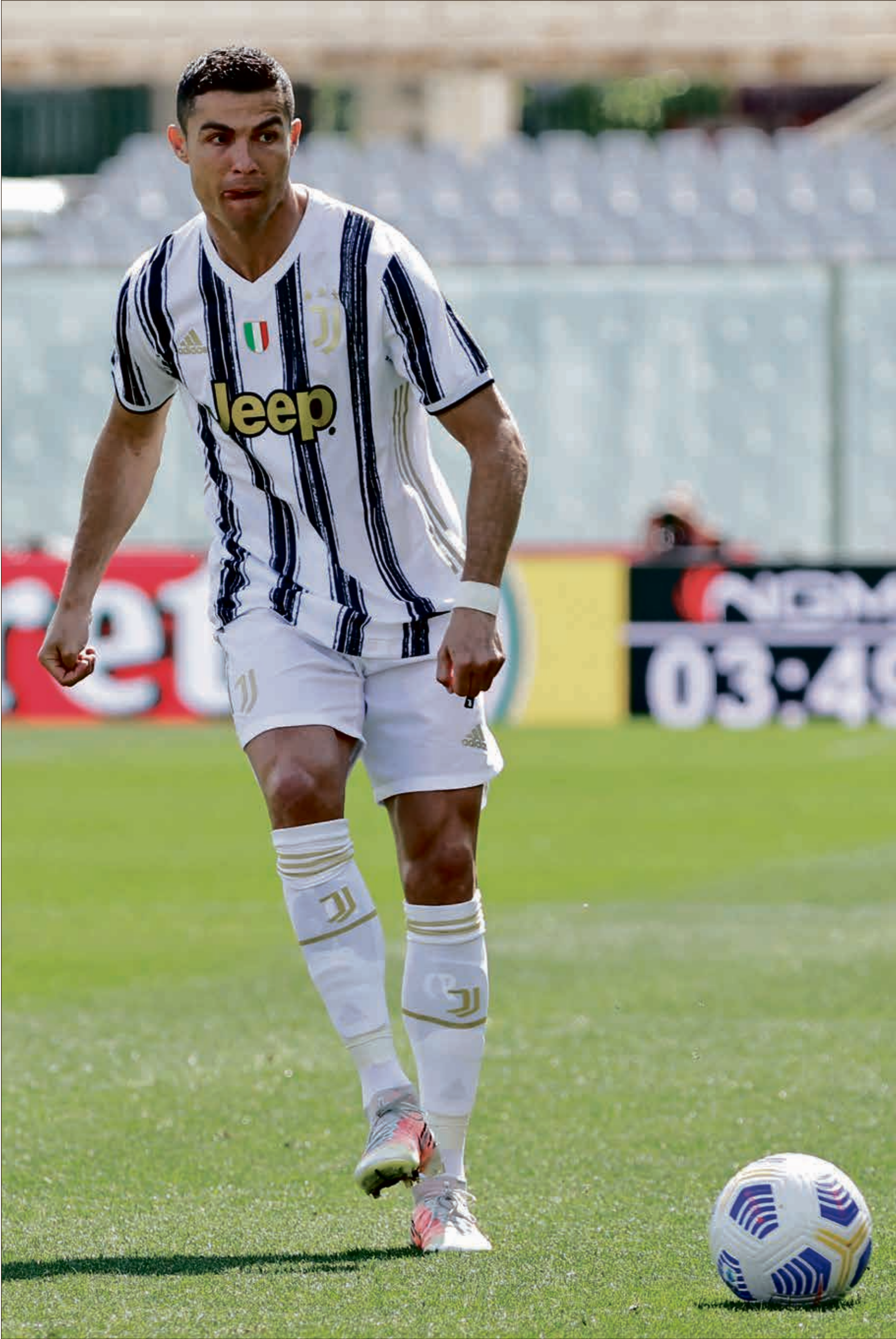
هل يُغادر رونالدو فريق يوفنتوس؟

كشفت صحيفة «ماركا» الإسبانية أن مهاجم فريق يوفنتوس، البرتغالي كريستيانو رونالدو، يعجز عن إيجاد وجهة جديدة له، بعد رفض ريال مدريد فكرة عودته. وأشارت الصحيفة الإسبانية إلى أن يوفنتوس ورونالدو يمران بلحظة دقيقة للغاية، بسبب النتائج السيئة والوضع الاقتصادي السلبي والعلاقات المتوترة في الفريق، الأمر الذي قاد الجميع، النادي واللاعب ووكيل أعماله، إلى إعادة التفكير، فاين ستكون وجهة رونالدو؟