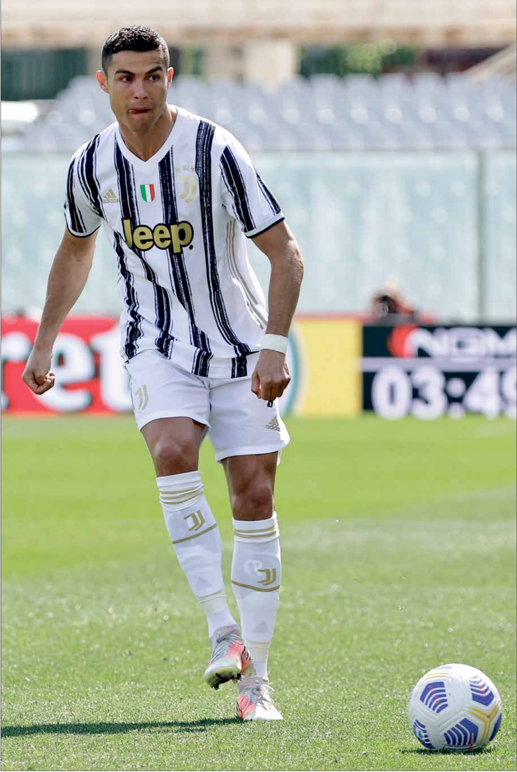
هنا تعاد رونالدو يوفنتوس