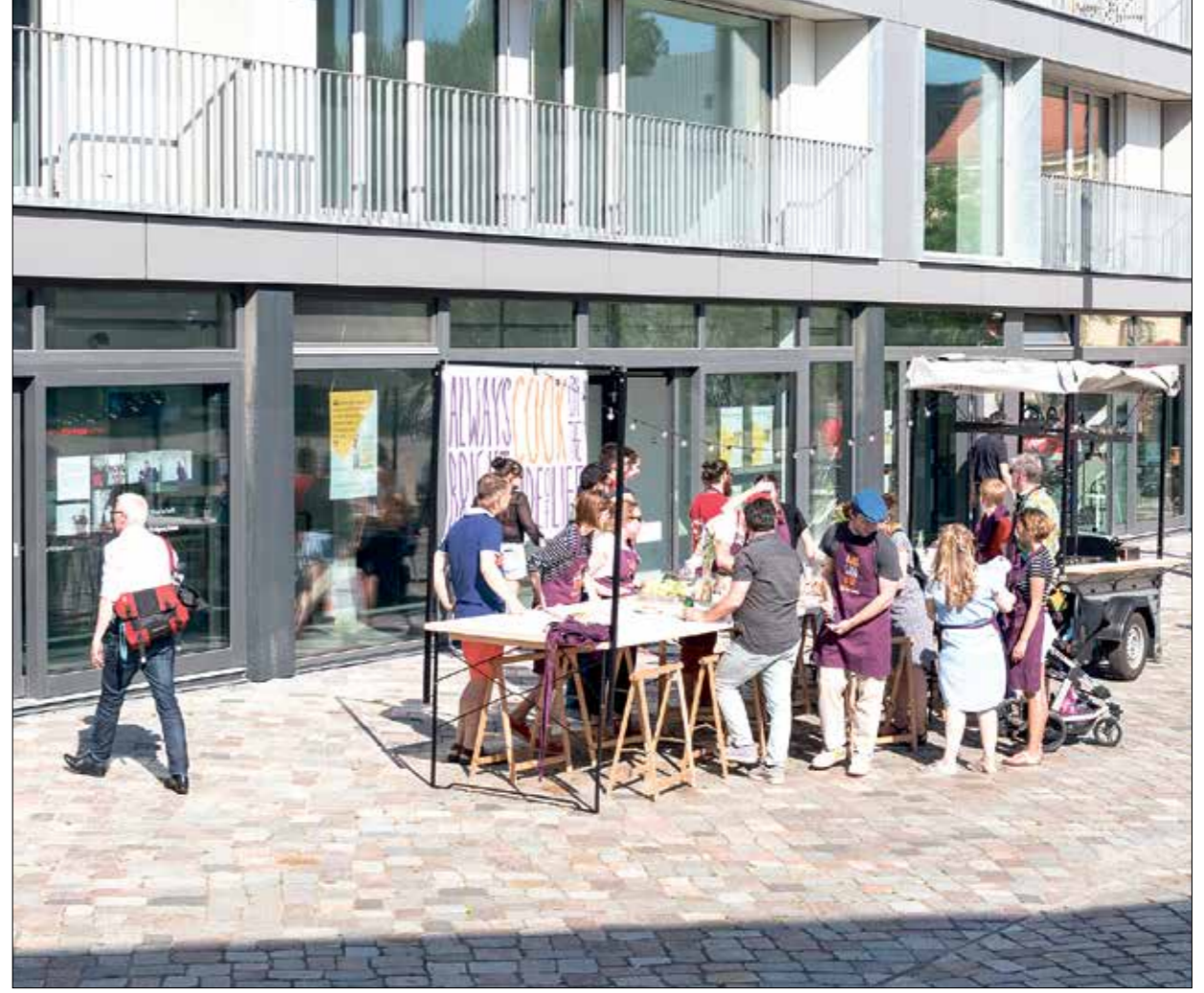
كانت الفعاليات الموسيقية تقام على أداء الحفلات وبعض الدروس (العربي الجرد)

ترامه افتتاح أول معهد للموسيقى العربية في برلين، مع زروح المدينة الألمانية تحت إجرامات إغلاق جديدة تطليها مواجهة مستمرة لموجة ثانية من الجائحة العالمية كوفيد-19، فقد انطلق أول النشاطات والفعاليات رقمياً على الإنترنت