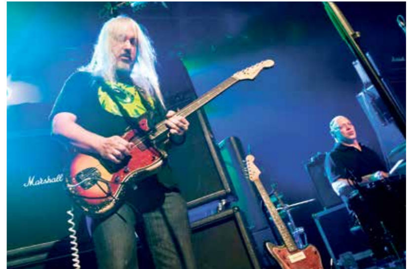
ظهرت «ديناصور جونيور» المزمرد على المسرح الكلاسيكية الساندة

بهذه الزعرة القائمة على فهم عميق لعناصر موسيقى الروك وتطورها، أسهمت «ديناصور جونيور» في رسم معالم تيار الروك الجديد في التسعينيات، إذ رسمت خطاً خاصاً بموسيقى الروك، في