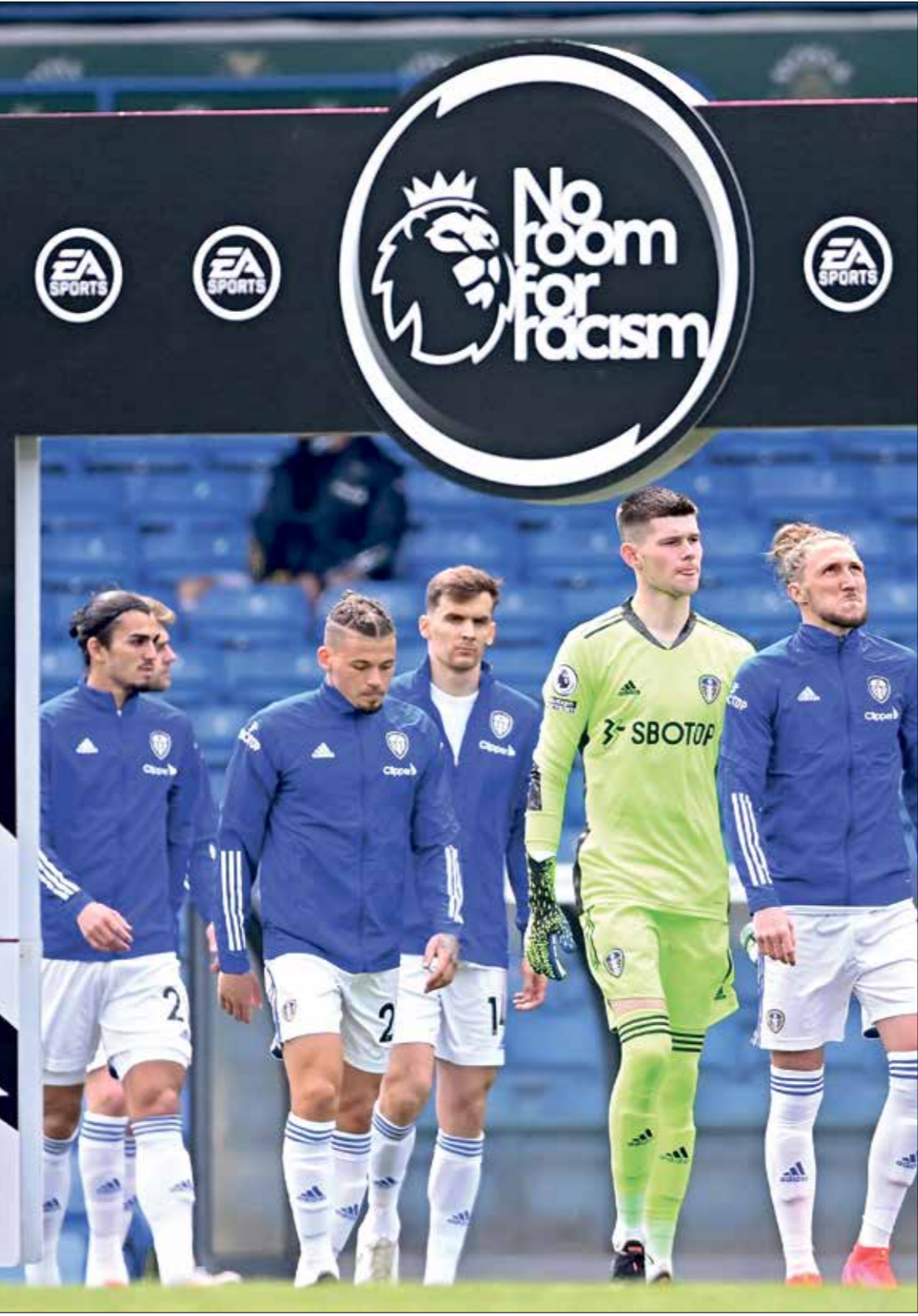
يحدث المقاطعة عصر الجمعة واستمر حلف اللين أروس غريميت، مارس (س)

وأصدرت شركة «تويتر» بياناً مطولاً في فبراير/ شباط الماضي، أكدت فيه «التراميز بضعاً محادثة ترويجية أمئة للجمهور، والاعتماد على منصتها، متغيرة إلى أنها خذت أكثر من 7 آلاف ترقية متعلقة بكرة القدم في المملكة المتحدة، لانتهاكها قواعدنا».