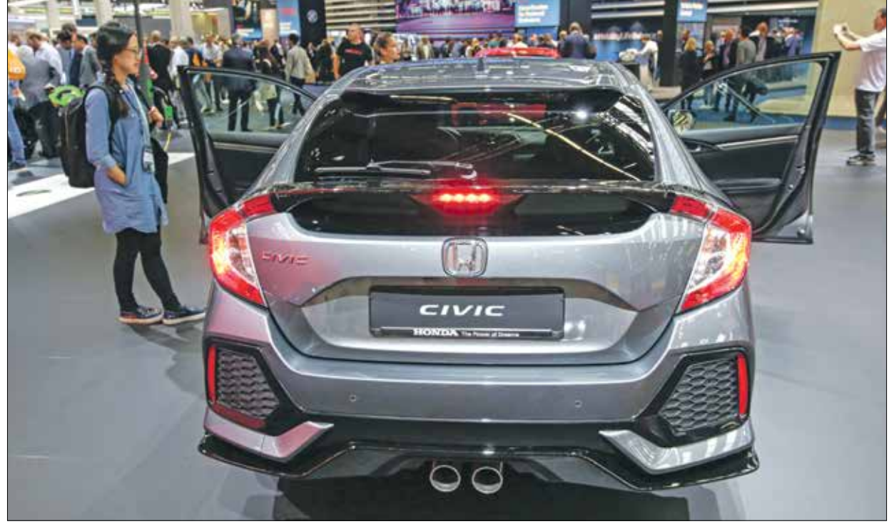
هوندا سيفيك، تقدمت ك خيار تصنيف «كارماكس»