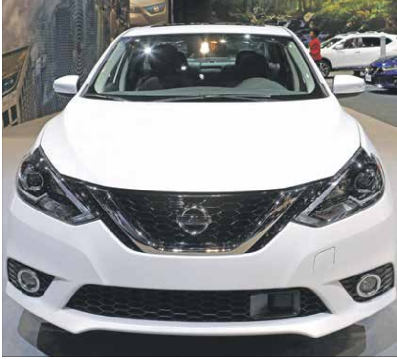
نيسان سيلارا، حلت في المرتبة الثانية بعد «سيفيك»