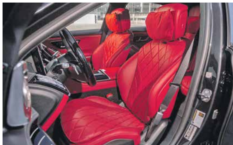
داخلية «مرسيدس- بنز S580 ماتيك» بين الفخم عالمياً

ومقاعدتها على شكل دلو مستوحاة من الطائرات المقاتلة، مبطنة بإحكام مع جوانب طويلة لإبقاء السائق في مكانه أثناء السباق حول المنعطفات. وتعاين خطوطها الصارمة الوركين والكثفين، بما يقيه جامداً منتهاها من دون منعه من تحريك رأسه ومرفقيه وذراعيه. والمقاعد مغطاة بجلد الكانتارا والسباق ذات الخمس نقاط. 4 - «كونيغسيغ جيميرا» موديل 2021: سيارة كهربائية خارقة ينطلق سعرها من 1,7 مليون دولار، تم ضبط المقاعد الخلفية أعلى قليلاً من المقدمة لضمان خطوط رؤية واضحة ومساحة قصوى. وتلك الأمامية قابلة للتعديل كهربائياً في 4 اتجاهات، وثمة مساحة كافية لاستيعاب 4 بالغين بشكل مريح، إضافة إلى حقائب اليد. والمقاعد على شكل دلو مصنوعة من إسفنج «ميموري فوم» مدمج لتوفير دعم مثالي بطول العمود الفقري كاملاً. والمقصورة خالية من العوائق للركاب في الأمام والخلف. وتحمل حاملات الأكواب الثماني درجات حرارة ساخنة وباردة، بينما تُضاف إلى وسائل الراحة شاشات المعلومات والترفيه الأمامية والخلفية، وأجهزة الشحن اللاسلكية، وأربعة مصابيح للقراءة.